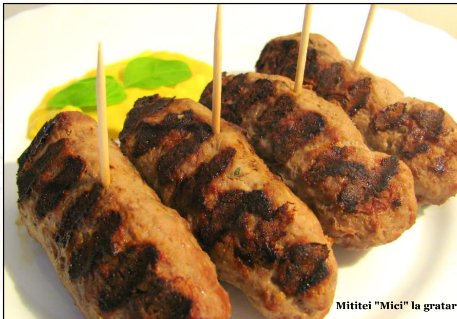
Mititei "Mici" la gratar