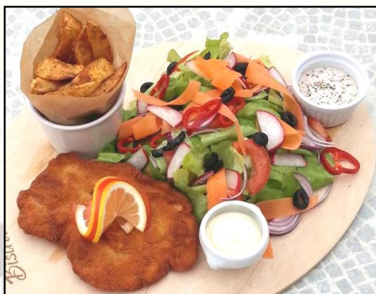
Planchette salata snitzel di polo