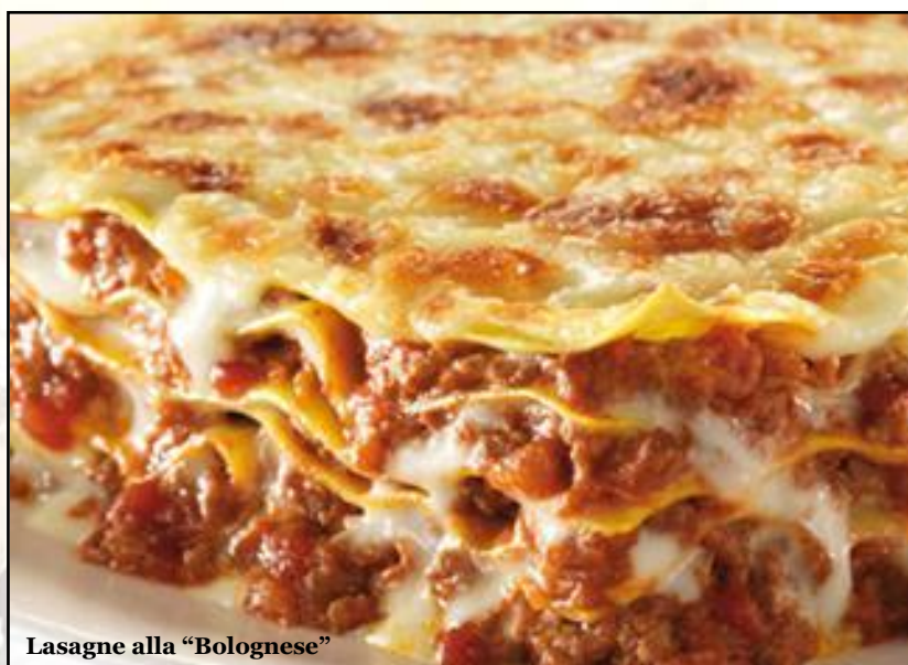
Lasagne alla "Bolognese"

Opțiuni Pasta : Spaghetti - Penne – Linguine