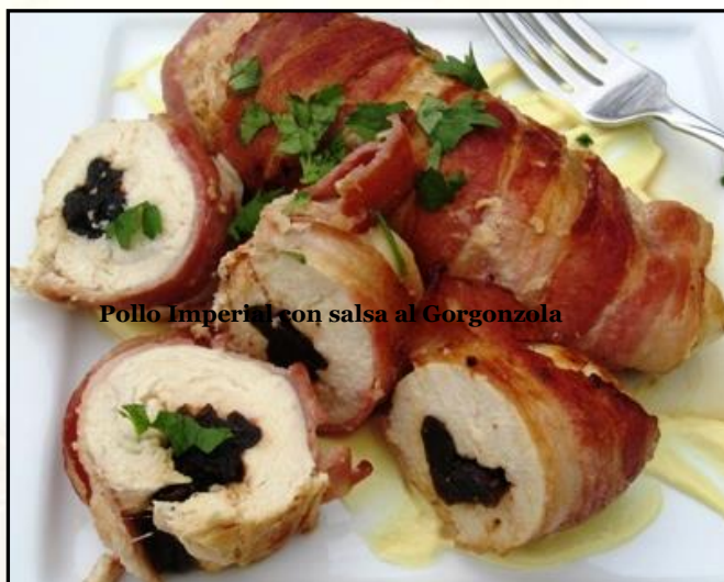
Pollo Imperial con salsa al Gorgonzola